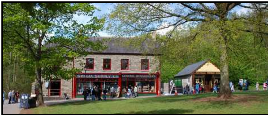
magasin de Gwalia

Construit en 1948 , reconstruit en 2001.